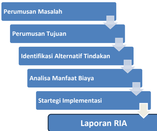
Gambar 14.2: Konsultasi Stakeholders Tahapan Regulatory Impact Assessment (RIA)

Konsultasi publik dilakukan pada setiap tahapan melalui diskusi dengan stakeholder dan menyebarkan rancangan laporan RIA kepada masyarakat. Ketujuh tahapan RIA ini dapat digambarkan dalam diagram berikut: